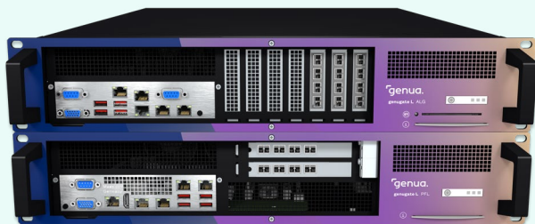
genugate bietet zwei Firewall-Systeme in einer hochsicheren Lösung