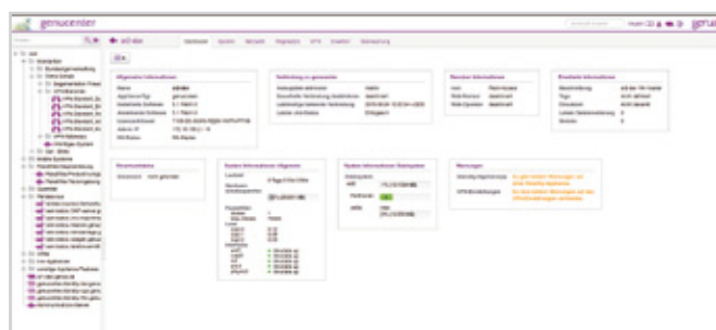
Alle Systeme im Blick über Management Station genucenter