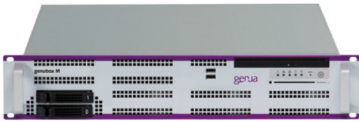
Leistungsstarke genubox M für Server Rack