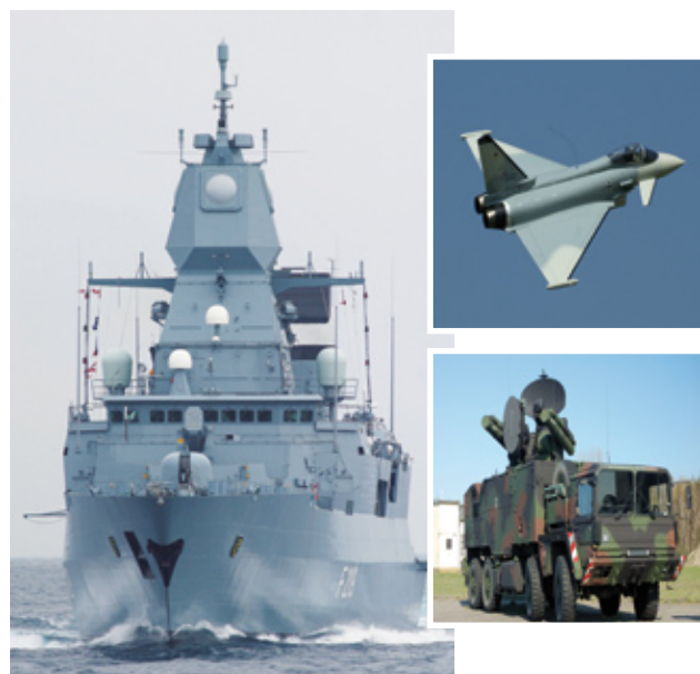
RSGate ist flexibel einsetzbar

Das RSGate ist vielseitig einsetzbar – sowohl stationär an Land als auch an Bord von Schiffen und Fahrzeugen. Somit können Netzwerk-Übergänge in vielfältigen Einsatzumgebungen und allen Teilstreitkräften mit dieser Sicherheitslösung kontrolliert werden.